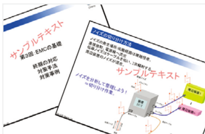
実践的な内容の独自テキスト