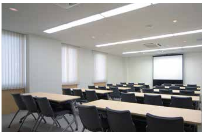
当社会議室：20～30名が出席可能