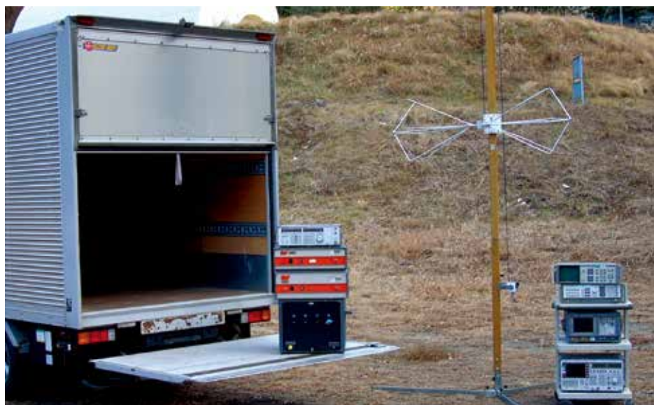
バイコニカルアンテナ他、測定装置