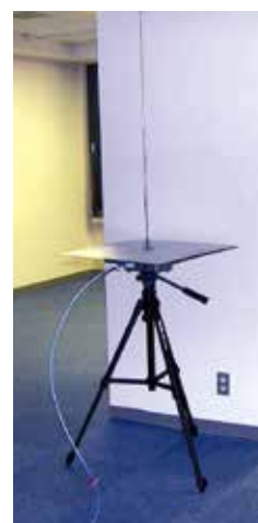
磁界測定アンテナ(低周波用)