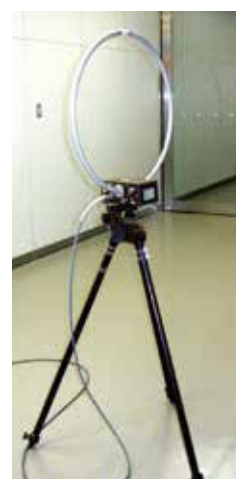
電界測定アンテナ