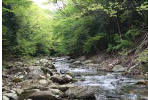
サイトすぐ横にある清流・芦川溪谷に歩いて降りられます。 EMC試験や対策の疲れを癒やしてくれる緑豊かな環境をお楽しみください。