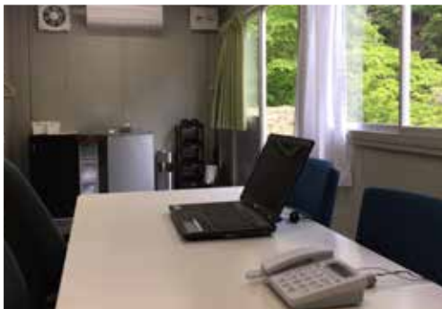
測定控室にはパソコン、電話等を完備しております。 インターネット接続も可能です。