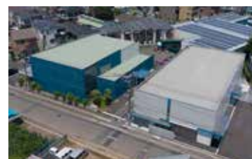
上空から見たA棟(写真左)とB棟(同右)