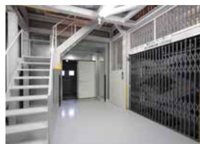
10m法電波暗室地下の搬出入用エレベータ