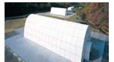
山梨 EMCセンター芦川試験所オープンサイト全景