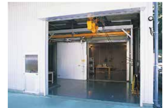
大型電波暗室搬入口